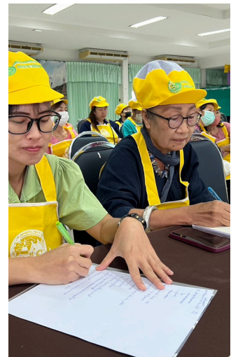
◀ ส่งเสริมมาตรฐานสุขาภิบาลอาหารให้พ่อค้าแม่ค้า และคุ้มครองสุขภาพผู้บริโภค มีอาหารที่สะอาดและ ปลอดภัย