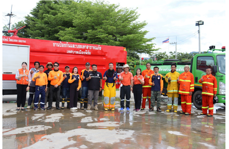
▶ พนักงานกำลังซ้อมแผนป้องกันและบรรเทา สาธารณภัย ยกระดับการป้องกันภัยให้มี ประสิทธิภาพสูงสุด